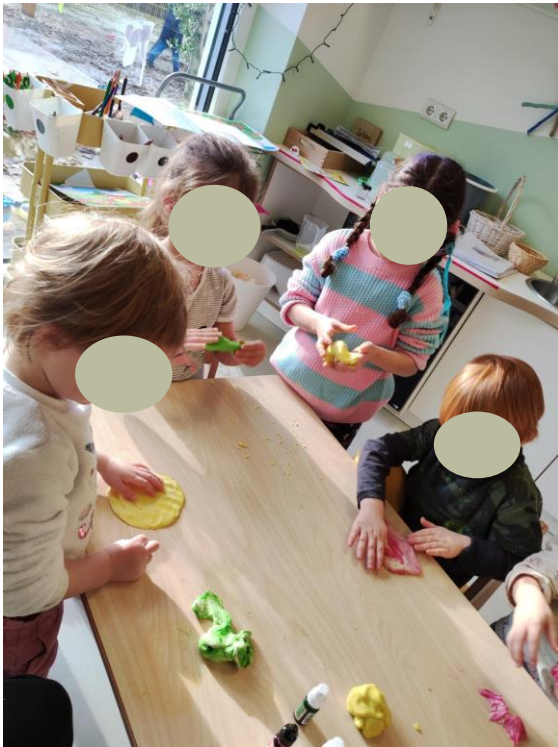
Die Kinder der NussHütte haben im vergangenen Winter die Rolle der Großmutter in einem Rollenspiel übernommen. Sie haben kreativ gearbeitet und die Puppen versorgt.