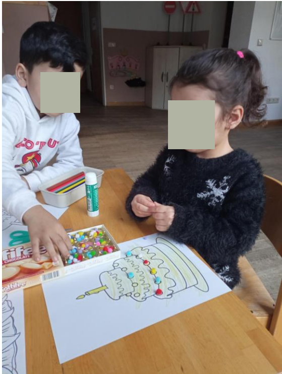
Die Torte wird bunt verziert.

Viel Spaß im Januar hatten auch Kinder und Fachkräfte aus dem FBO Kirchhainer Damm. Es wurde viel gebastelt, gebaut und gemeinsam Hüpf- und Bewegungsspiele gespielt.