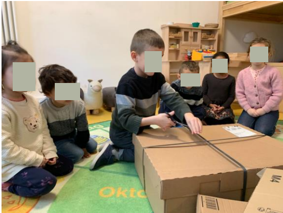
Was da wohl drin ist? Alle warten gespannt.