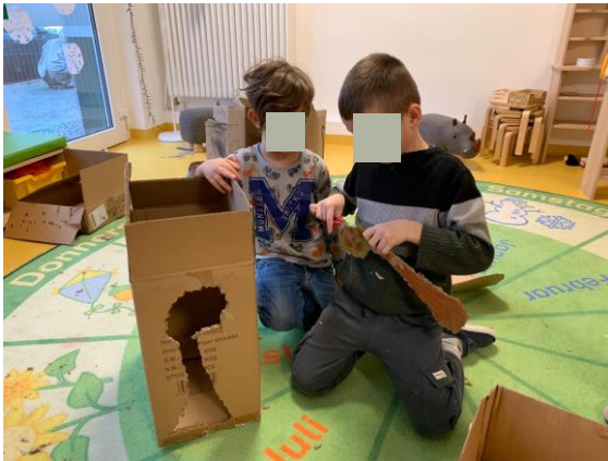
Kreative Ideen werden umgesetzt...