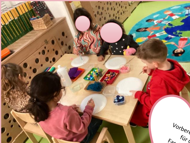
Vorbereitungen für die Faschingsfeier