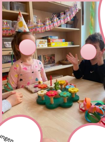
Bei den Walnüssen gibt es eine große Geburtstagsfeier