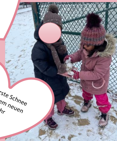
Der erste Schnee in diesem neuen Jahr